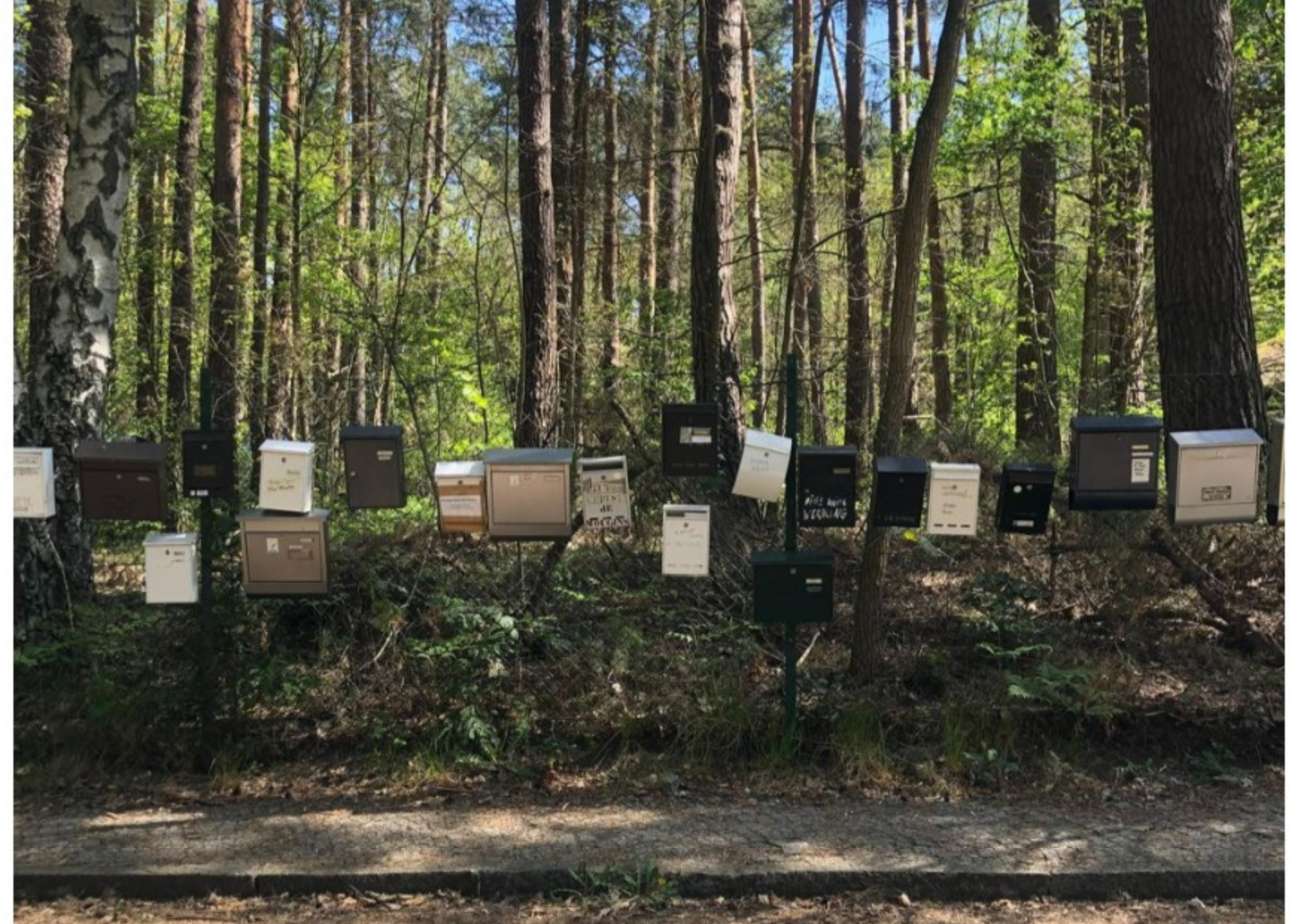
Die Briefkästen am Eingangsbereich zum Hof sind ein beliebtes Fotomotiv.